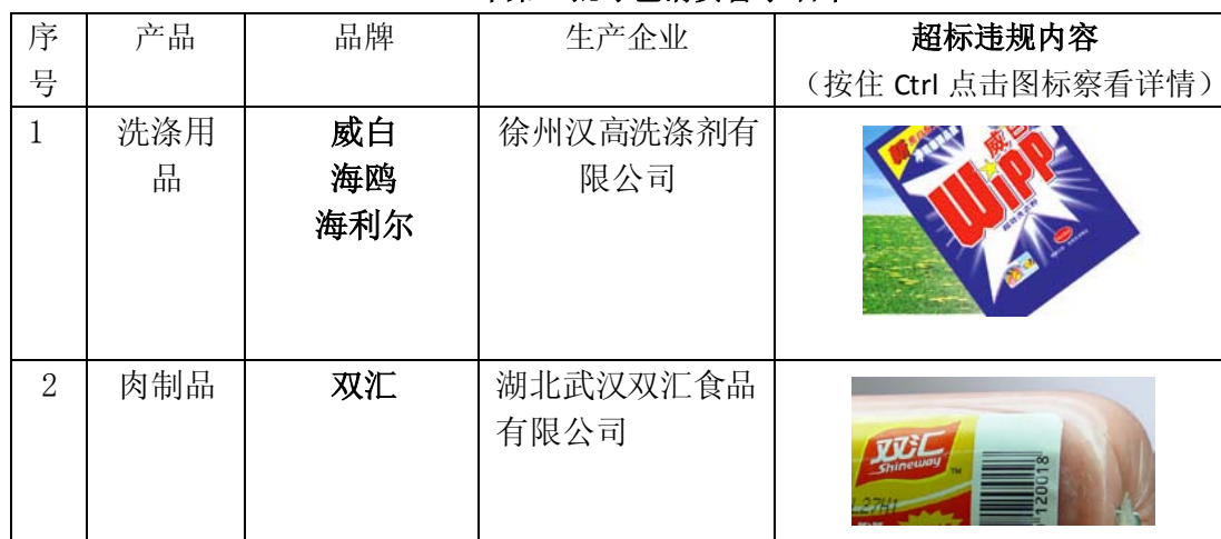
2010年第一批绿色消费警示名单

同时，我们呼吁大量采购这些品牌的零售商和其它大型企业，留意这些品牌，在生产企业公开证明已经改正之前，谨慎选择其产品。